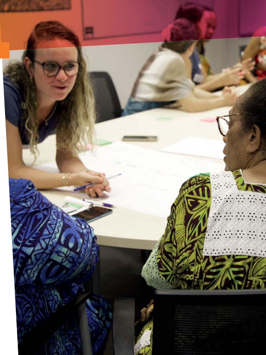
Atelier de travail avec les acteurs touristiques

> En partenariat avec la province et Sud Tourisme, la CCI-NC a été mandatée pour accompagner