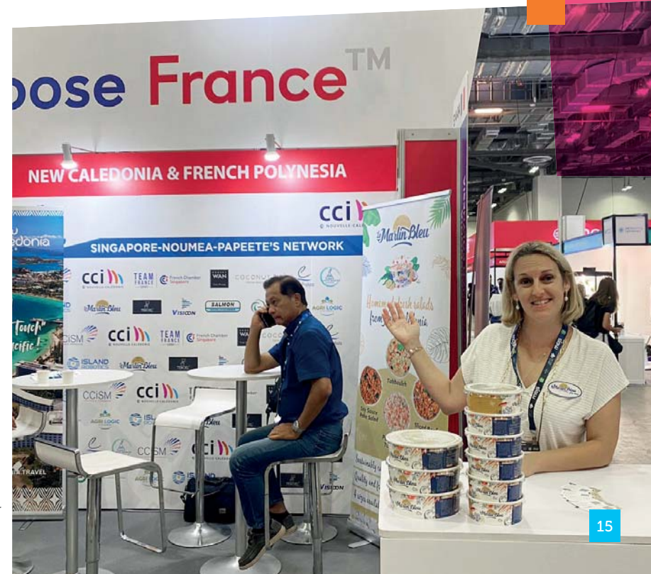
Première mission économique à Singapour au salon Agri-food Tech Expo Asia.

Ce déplacement a validé l'attention de la Chambre pour les opportunités économiques dans la région et sa volonté de structurer l'accompagnement des entreprises en s'engageant sur le réseau Team France Export.