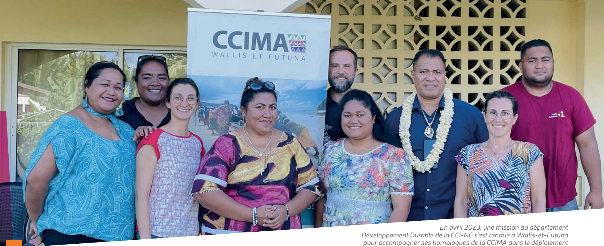
En avril 2023, une mission du département Développement Durable de la CCI-NC s'est rendue à Wallis-et-Futuna pour accompagner ses homologues de la CCIMA dans le déploiement du dispositif Fonds tourisme durable.