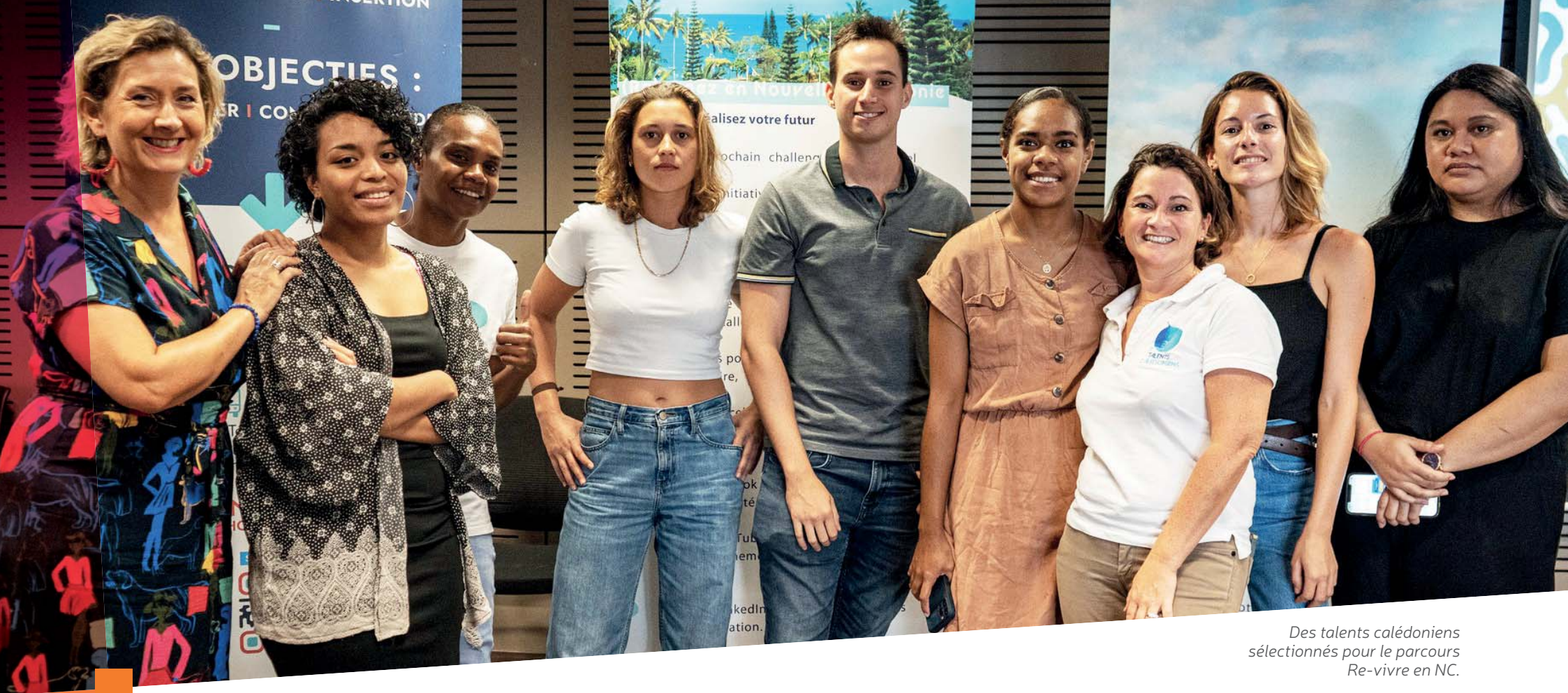
Des talents calédoniens sélectionnés pour le parcours Re-vivre en NC.