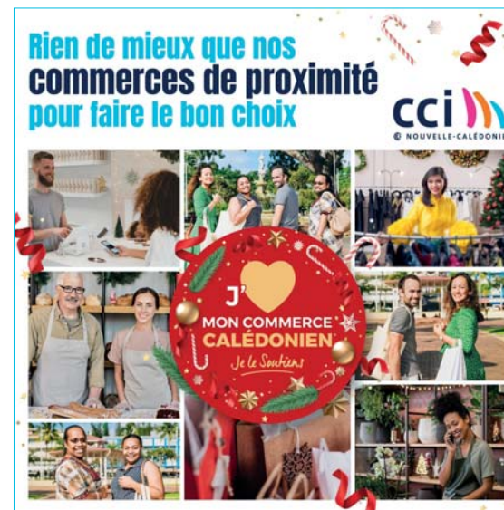
Campagne de soutien pour les commerçants locaux.

■ La CCI-NC et la Fédération des industries de Nouvelle-Calédonie ont développé la marque Cagou , une nouvelle marque territoriale pour valoriser l'industrie locale ainsi que l'écosystème économique lié (fournisseurs, intermédiaires, distribution). Derrière cette marque collective présentée en 2023, se trouvent un cahier des charges et des valeurs inscrites dans une charte d'engagement pour les industriels qui souhaiteraient l'apposer sur leurs produits. Les Calédoniens sont ainsi assurés d'une consommation « en circuit court » présentant moins d'impacts environnementaux et de participer à développer la rentabilité d'entreprises locales citoyennes.