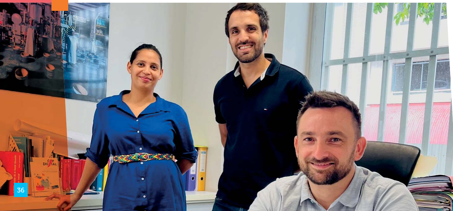
Les conseillers CCI au service des entreprises.

■ Mutualisation de locaux et de services avec les autres Chambres consulaires pour assurer une bonne présence de la CCI-NC dans les communes en Brousse. Ainsi, les antennes de La Foa, Koumac et Poindimié sont partagées entre la CCI-NC et la Chambre de métiers et d'artisanat (CMA-NC). En 2022, la CAP-NC a inauguré sa nouvelle agence à Bourail, qui a également signé le retour de la CCI-NC de façon permanente dans cette commune économiquement dynamique. L'objectif de ces mutualisations est de pouvoir proposer un primo-accueil et un guichet de formalités en continu, ce qui permet aux conseillers CCI, pendant leurs permanences, de se concentrer sur leur mission d'accompagnement des porteurs de projet et des entrepreneurs.