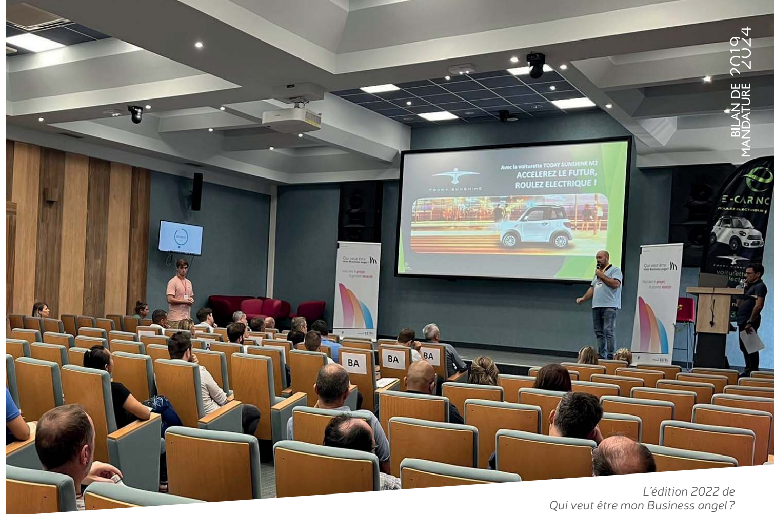
L'édition 2022 de Qui veut être mon Business angel ?

■ Déjà très active sur le volet accompagnement et développement d'entreprises, la CCI-NC a souhaité également s'impliquer sur la partie du financement. Dans cet objectif, elle a conçu « Qui veut être mon business angel ? », une opération inédite, inaugurée en 2021. Objectif : permettre aux porteurs de projet à la recherche de financement d'être mis en relation avec des investisseurs potentiels. Au-delà de capacités de financement, les candidats bénéficient également de conseils, de partages d'expérience et de réseaux de chefs d'entreprise expérimentés.